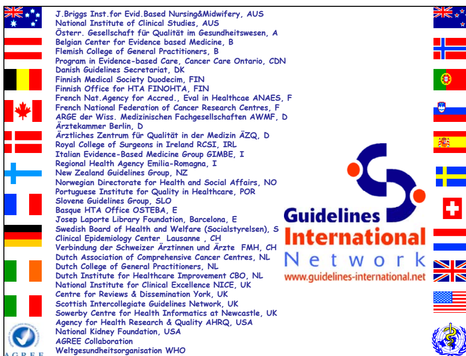
Abbildung 2: Gründungsmitglieder des internationalen Leitlinien-Netzwerks G-I-N

Das breite Interesse an medizinischen Leitlinien beruht auf der Tatsache, dass die Gesundheitssysteme der industrialisierten Länder mit vergleichbaren Problemen konfrontiert werden: steigenden Kosten infolge erhöhter Nachfrage nach Gesundheitsdienstleistungen, immer teurer werdenden Technologien, alternden Bevölkerungen; Qualitätsschwankungen mit zum Teil inadäquater Gesundheitsversorgung; und dem selbstverständlichen Wunsch der Leistungsanbieter bzw. der Patienten nach bestmöglicher Versorgung. Vom systematischen Einsatz von Leitlinien verspricht man sich eine konsistenter und effizientere Gesundheitsversorgung auf der Grundlage der besten verfügbaren wissenschaftlichen und praktischen Erkenntnisse.