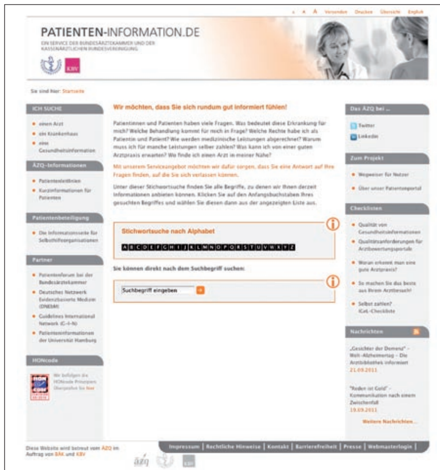
Abbildung 1: Patientenportal von Bundesärztekammer und Kassenärztlicher Bundesvereinigung www.patienten-information.de .

Patientenleitlinien sind aufgrund ihres Konzeptes umfangreiche, komplexe Dokumente für Menschen, die sich sehr genau informieren wollen. Seit 2010 entwickelt das ÄZQ im Auftrag der KBV auch kompakte Kurzinformationen für Patienten zu wichtigen Erkrankungen.