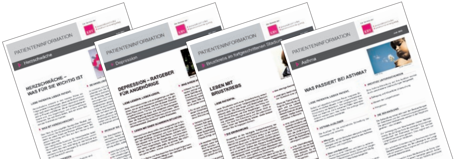
Abbildung 2: Kurzinformationen für Patienten (KIP).

Diese KIP vermitteln auf einem doppelseitigen Dokument im DIN-A4-Format in leicht verständlicher Form die wichtigsten Inhalte einer Patientenleitlinie. Wenn zu einem bestimmten Thema keine Patientenleitlinie vorliegt, dient eine systematische, hochwertig aufbereitete Evidenzübersicht als Grundlage. Und für Patienten ganz wichtig: Jede Information enthält eine Rubrik „Was Sie selbst tun können“. Eine Beteiligung der BÄK an diesem Projekt startet 2012. Bisher sind 16 Kompaktinformationen erschienen. Sechs weitere sind für 2011 geplant. Alle stehen auf den Webseiten der KBV und dem geschützten Netzwerk der KVen (KV-SafeNet) sowie auf den ÄZQ-Portalen zum Herunterladen bereit. Bei Bedarf können Ärzte die Kurzinformationen ausdrucken und ihren Patienten aushändigen. So können sie ihre Patienten verlässlich informieren und selbst profitieren: Hochwertige Informationen unterstützen den Therapieprozess und das Vertrauensverhältnis zwischen Arzt und Patient. Um auch fremdsprachige Bürger besser zu erreichen, werden demnächst