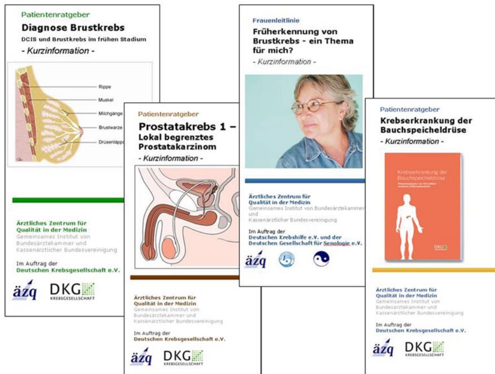
Abb. 2 ◀ Kurzübersichten zu den onkologischen PatientenLeitlinien.

entenLeitlinien sowie die Vorgehensweise bei der Erstellung der PatientenLeitlinien beinhaltet.